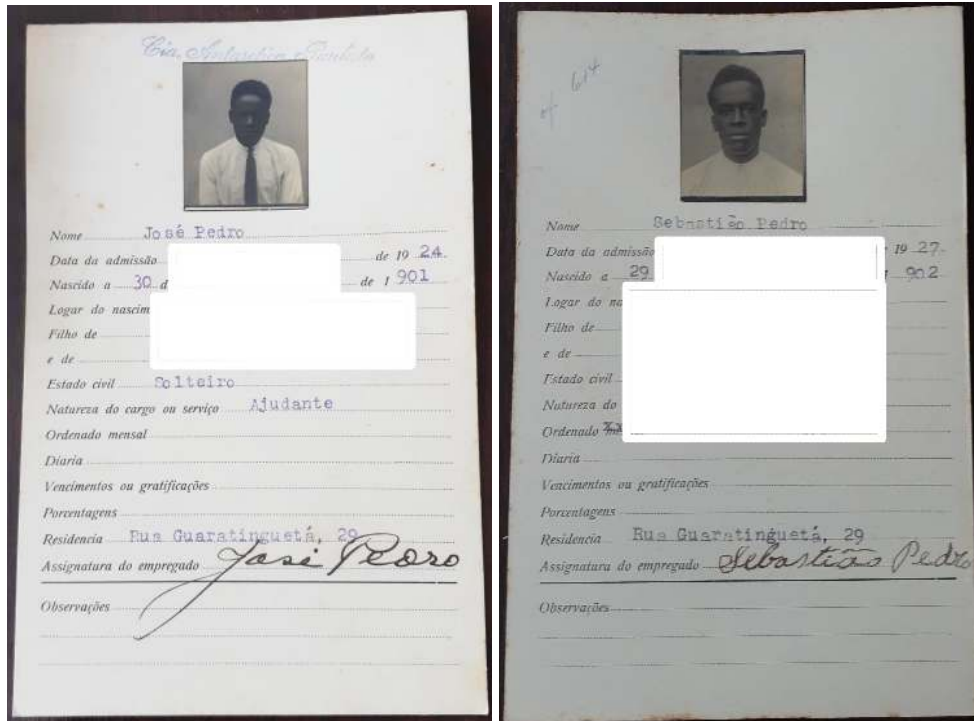
Figura 1. Funcionários que moravam na rua Guaratinguetá.